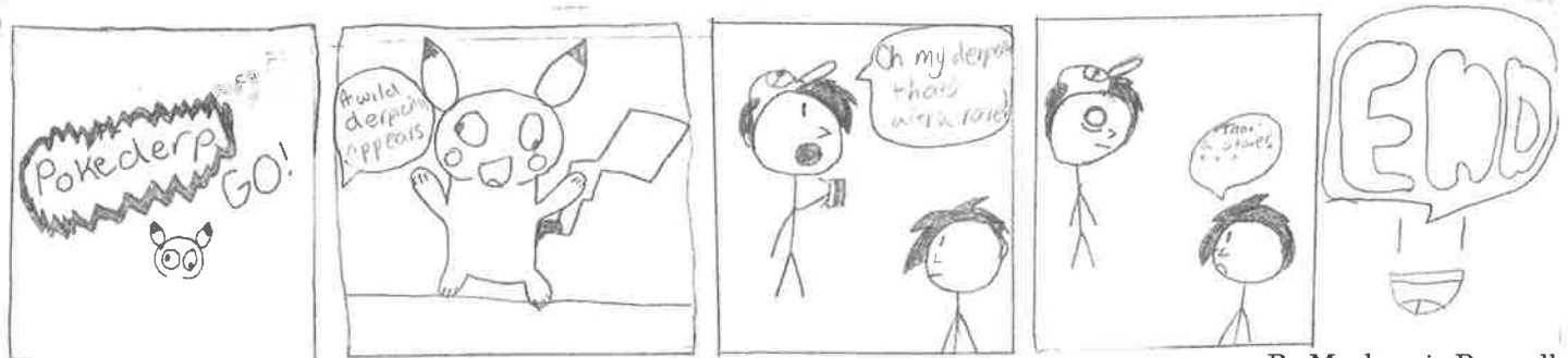
By Mackenzie Bagwell

Sep. 10-11 10-11 de septiembre Dec. 10-11 10-11 de diciembre Feb. 25-26 25-26 de febrero May 6-7 6 a 7 de Mayo